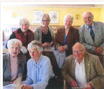
Erzählcafé im Alt Lohbrügger Hof.