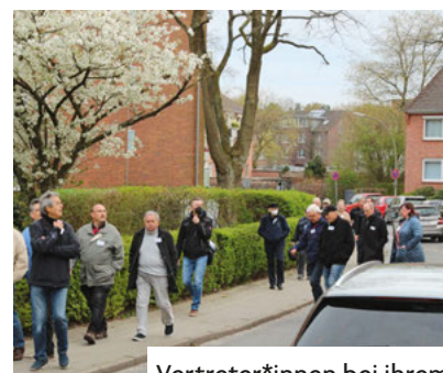
Vertreter*innen bei ihrem Quartierrundgang

Demokratisches Prinzip – so funktioniert unsere Genossenschaft!