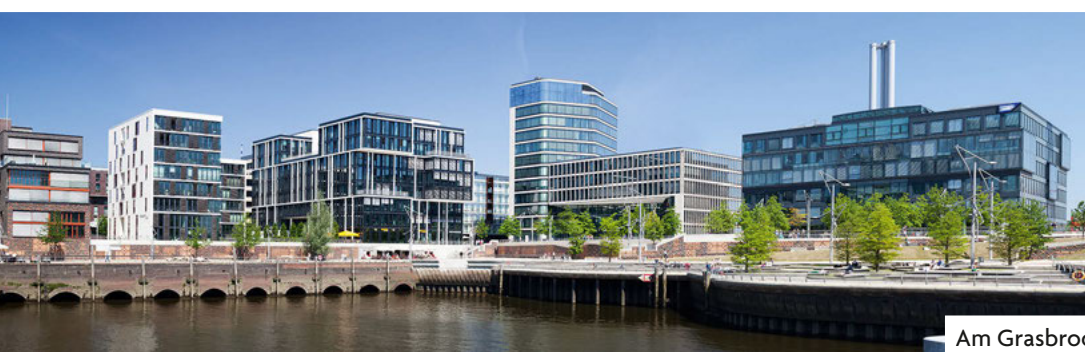
Am Grasbrookhafen befinden sich auch die einladenden Marco-Polo-Terrassen.

W ir freuen uns, Ihnen unser Neubauvorhaben Strandkai in der HafenCity vorzustellen! Das Grundstück wurde uns zusammen mit weiteren namhaften Investoren anhand gegeben. Auf dem Areal soll ein gesunder Mix aus frei finanzierten Miet- und Eigentumswohnungen sowie Genossenschaftswohnungen entstehen. Zudem werden Gewerbeflächen für eine attraktive, publikumswirksame Nutzung errichtet.