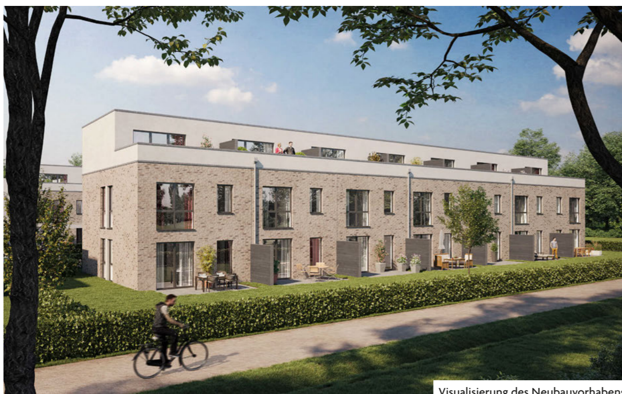
Visualisierung des Neubauvorhabens.

Neubau Haferblöcken 2.2 – der nächste Teilabschnitt startet!